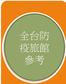
防疫旅館訂 房確認單