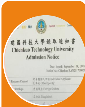
建國科技大 學入學許可 通知書