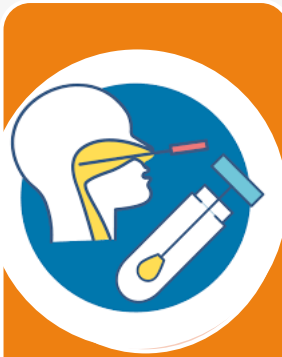
登機前三天 陰性核酸檢 測報告