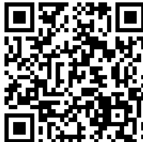
我要留言給CTU國合處

If you require any further information, feel free to contact us.